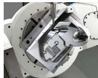
5軸マシニングセンタ用 CAM